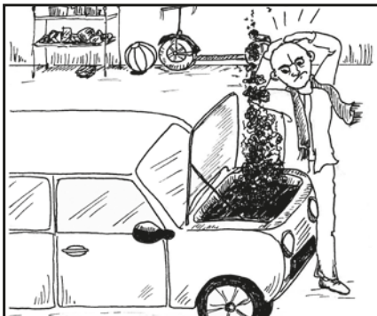
Grrrrrr - wat nu...