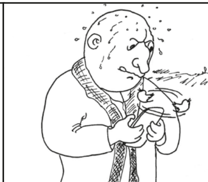
#verlaat door kapotte auto#ik kom