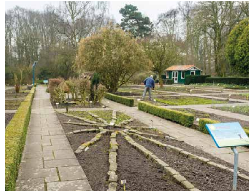
Het Zuiderpark in Den Haag met werkgestraften via de Haeghe Groep.

Na een vraag vanuit de Raad van de Kinderbescherming zijn we vier jaar geleden gestart met een pilot om jonge taakgestraften te plaatsen. Omdat we beschikken over de juiste