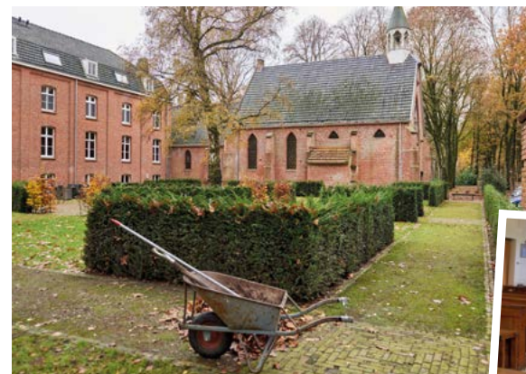
In het voormalig klooster werken werkgestraften en mensen met een afstand tot de arbeidsmarkt

‘In eerste instantie krab je dan even achter je oren. Je wilt natuurlijk niet dat medewerkers en gasten zich op enige manier onprettig voelen. Maar tegelijkertijd is Klooster Nieuwkerk Goirle ook een maatschappelijk betrokken bedrijf. Zo hebben we al iemand via de GGZ die alle tijd en ruimte krijgt om te re-integreren en iemand van de sociale werkplaats die fantastisch werk verricht in de kloostertuin. Ook werken hier,