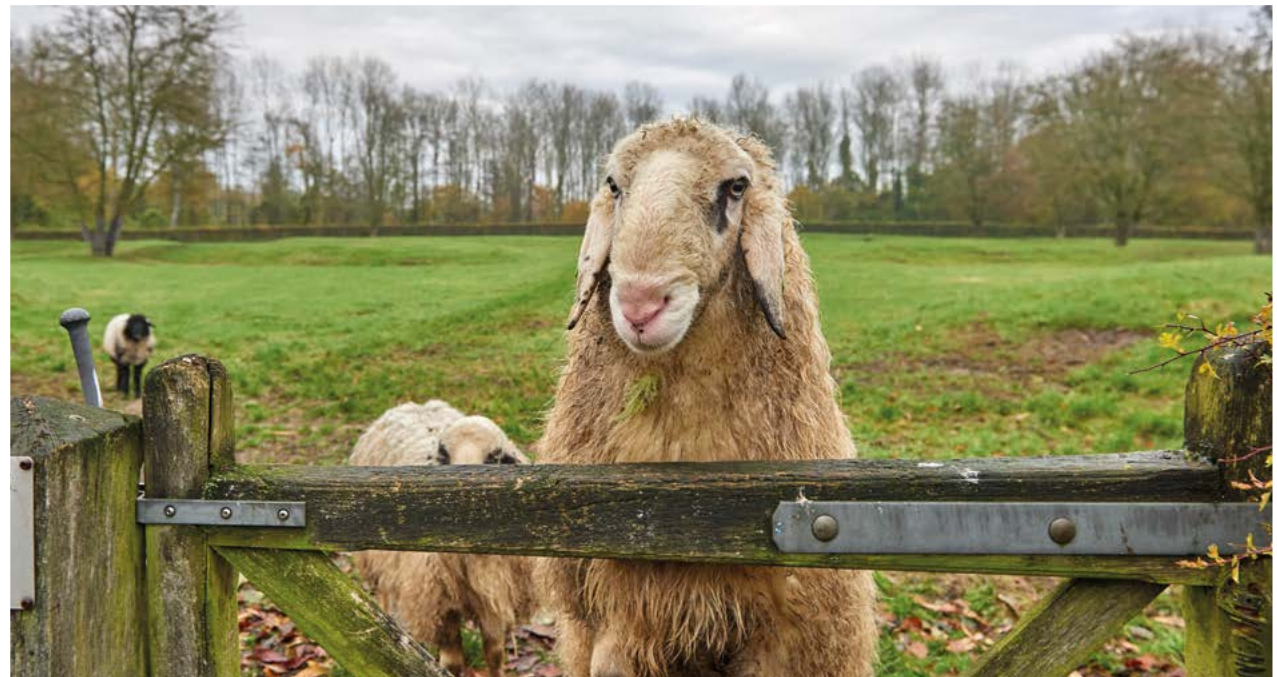
Op Stadslandgoed De Kempphaan verrichten werkgestraften nuttig werk voor verschillende samenwerkende organisaties