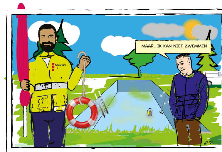
WERKGESTRAFTEN MAKEN ZWEMBAD ZOMERKLAAR

De moeder wil haar zoons behoeden voor een strafblad en neemt de schuld op zich. Bovendien oordeelt zij dat ze beter had moeten weten, de transactie werd immers met haar medeweten afgerekend. De rechter legt moeder 160 uur werkstraf op. Een forse straf, waar ze voorlopig wel even zoet mee is. Elke zaterdag prikt ze nu afval in Amsterdam Zuidoost. Onlangs kwamen haar zoons langs om te zien hoe hun moeder de werkstraf uitvoert. Moeder wil binnenkort graag meer uren maken, want in dit tempo zal ze pas in november klaar zijn. Inmiddels hebben moeder én haar zoons wel door dat 160 uur werkstraf geen kinderachtige straf is.